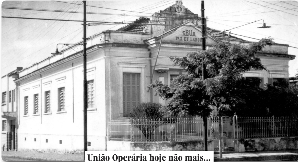
União Operária hoje não mais...