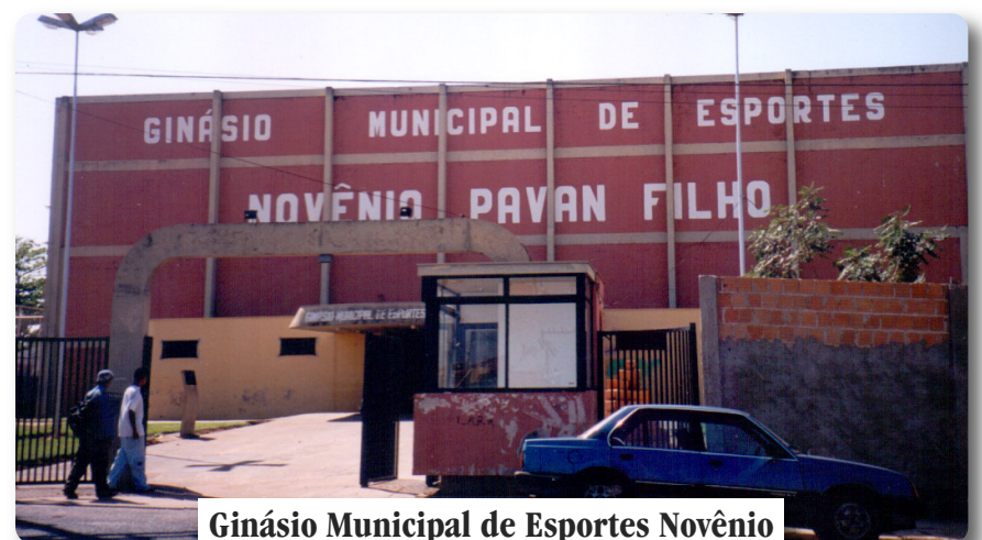
Ginásio Municipal de Esportes Novênio Pavan Filho em Américo Brasiliense