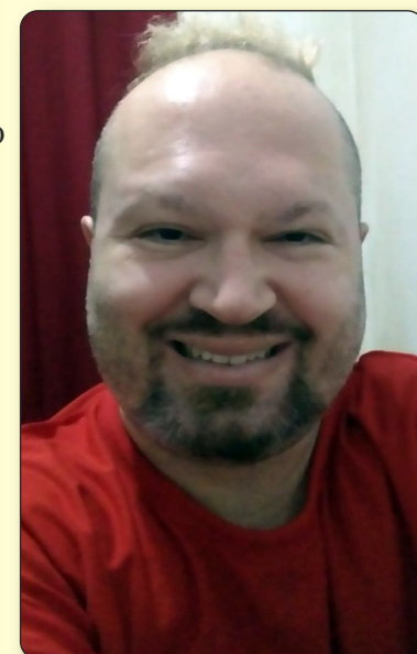
ESCRITOR BELLO 3.701 TEXTOS

Serpente! Temos que pisar nela Deus é o bem Ele é maior do que tudo, Eu piso na serpente, Deus está conosco! Deus está sempre comigo! Serpente! Ela é derrotada Deus é maior! Maior é Deus!