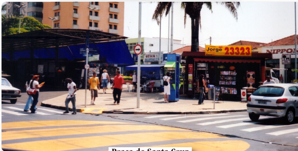
Praça de Santa Cruz