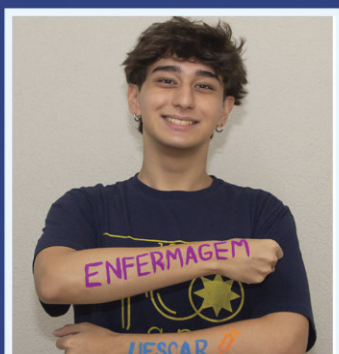
Unicus Yuji Onide Enfermagem - Ufscar Saúde Pública – USP – São Paulo