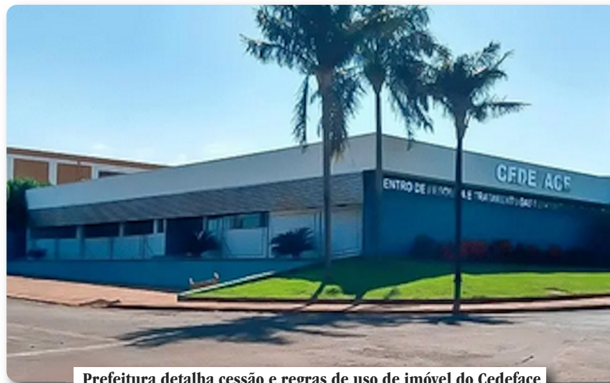
Prefeitura detalha cessão e regras de uso de imóvel do Cedeface

Com mais de três décadas de atuação, o Cedeface é referência no atendimento gratuito a pacientes com deformidades bucofaciais, oferecendo inclusive procedimentos de alta com-