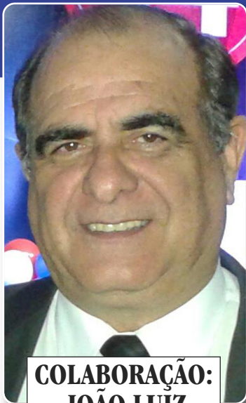
COLABORAÇÃO: JOÃO LUIZ ULTRAMARI

Onde ficamos sabendo dos que estão vivos, dos que se foram, dos que estão doentes e acamados. Lembranças dos amigos, principalmente vizinhos, das escolas, dos clubes de serviços, de entidades de classe, filantrópicas etc. Estamos vendo e participando de encontros de Amigos de Bairros, Escolas, Turma do Tiro de Guerra, Clu-