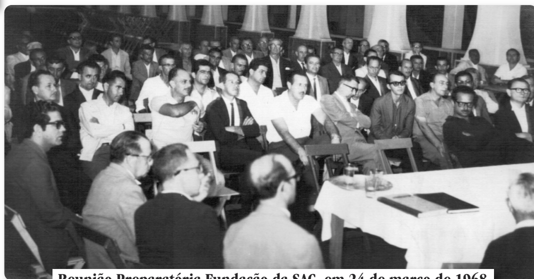
Reunião Preparatória Fundação da SAC, em 24 de março de 1968.