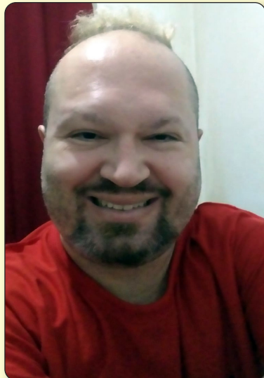
ESCRITOR BELLO 3.101 TEXTOS

Campeão! É aquele que faz o bem, Que ajuda o próximo, Campeão! É o que faz o melhor para si mesmo, E para os outros, Campeão! É o que luta por propósitos e objetivos, Campeão! É o que acredita em Deus Que deixa Deus guiar o teu caminho, Campeão! É o abençoado por Deus! Campeão! É sempre Campeão! Amém!