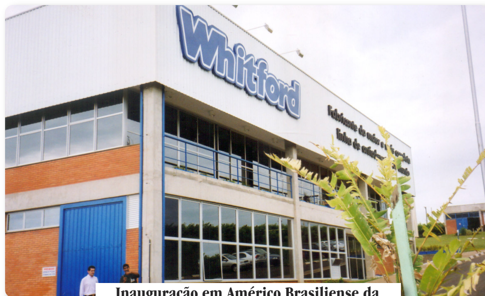
Inauguração em Américo Brasiliense da empresa Whitford em 31 de janeiro de 2003.