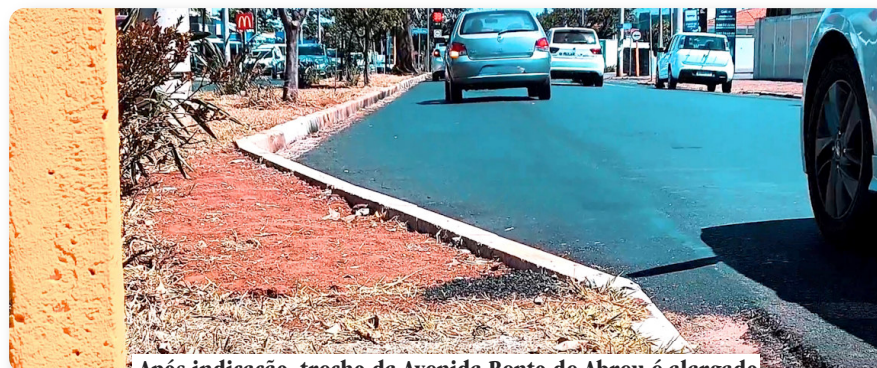
Após indicação, trecho da Avenida Bento de Abreu é alargado

Irregularidades na estrutura da Unidade de Saú-