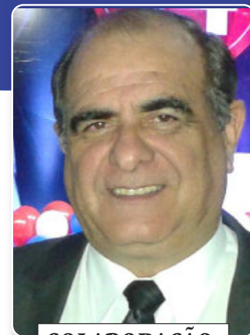
COLABORAÇÃO: JOÃO LUIZ ULTRAMARI

Como é bom ver nossas crianças aproveitando a vida com sua ino-