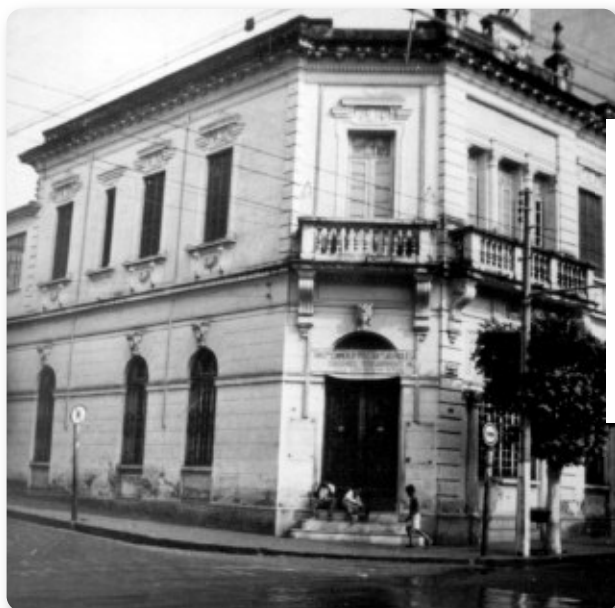
Banco do Comércio e Indústria de São Paulo na Rua São Bento esquina da Av. Portugal, em 1963.